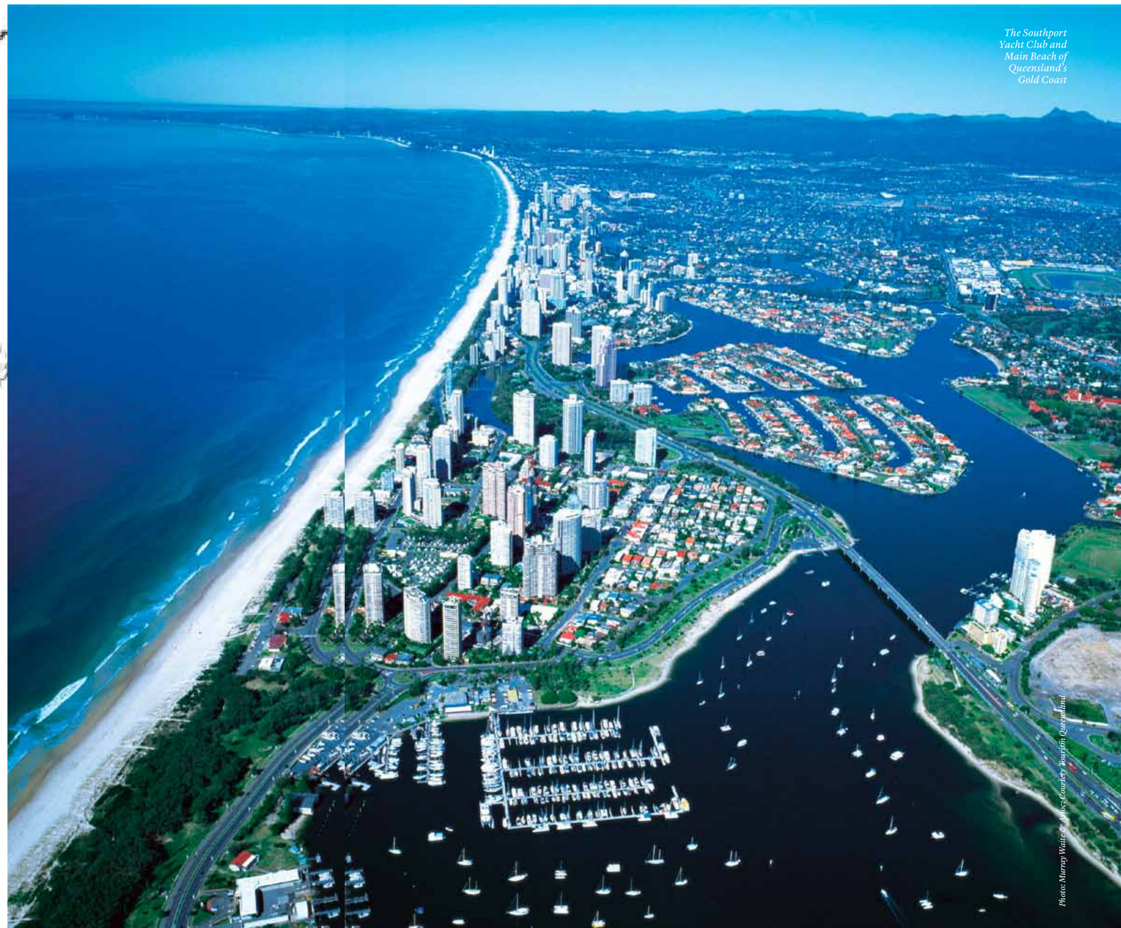
The Southport Yacht Club and Main Beach of Queensland's Gold Coast